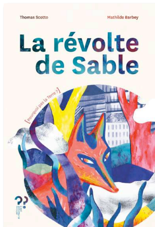
ill. Mathilde Barbey